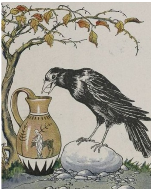
伊索寓言中的《烏鴉和水罐》故事提醒我們創造力的價值。